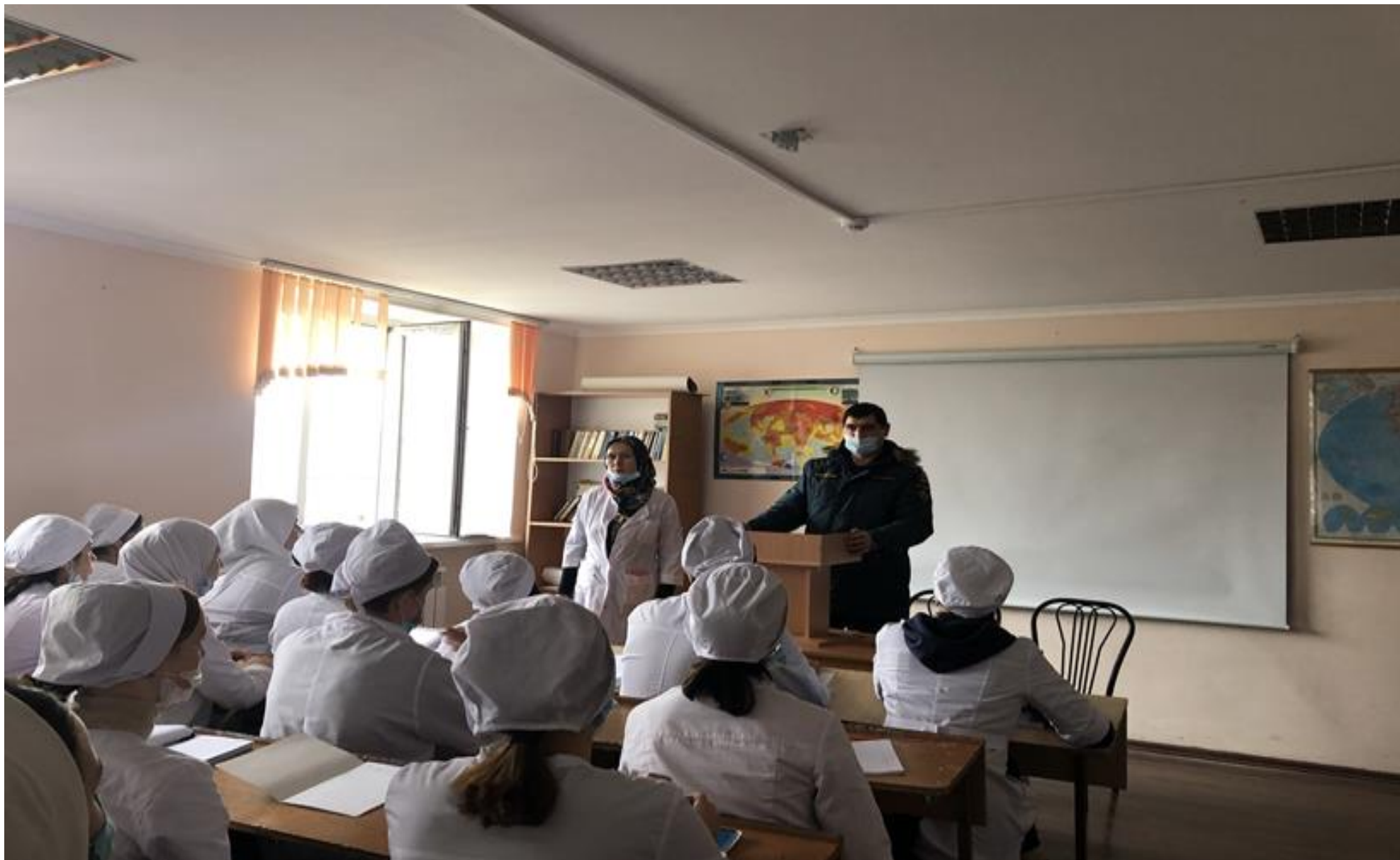
2 декабря в колледже состоялась профилактическое мероприятие в рамках Всемирного дня борьбы со СПИДом.