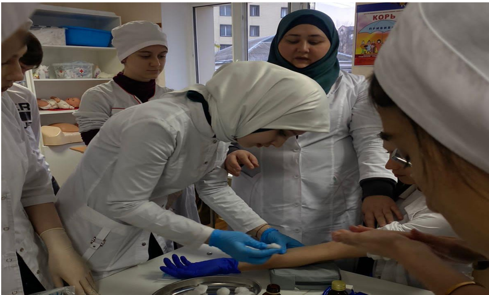
б). Расписание студенческого научного кружка (СНК) «ПИФАГОР»