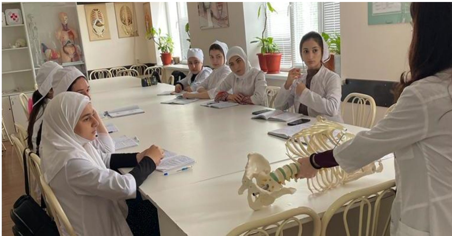
4). Расписание студенческого научного кружка (СНК) «АКУШЕРСТВО»