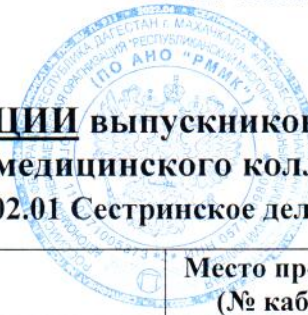
ГРАФИК прохождения ПЕРВИЧНОЙ АККРЕДИТАЦИИ выпускников ПОАНО «Республиканского многопрофильного медицинского колледжа» 2023-2024 учебного года по специальности 34.02.01 Сестринское дело