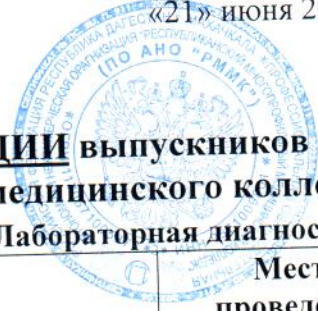
ГРАФИК прохождения ПЕРВИЧНОЙ АККРЕДИТАЦИИ выпускников ПОАНО «Республиканского многопрофильного медицинского колледжа» 2023-2024 учебного года по специальности 31.02.03 Лабораторная диагностика